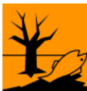
Ympäristölle vaarallinen (N)