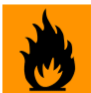
Erittäin helposti syttyvä (F+)