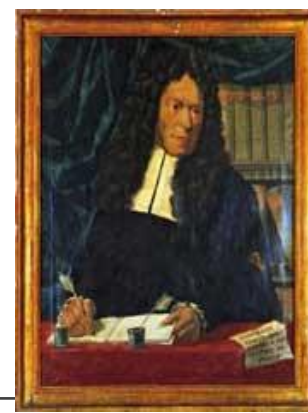
Bernardino Ramazzini, työlääktieteen "isä"